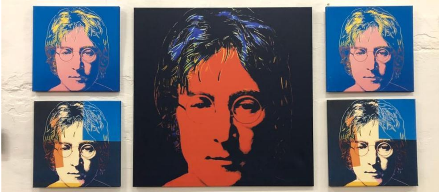
Pop Art trifft Popmusik: John Lennon-Porträts von Andy Warhol in Weilburg.

"Kunst für alle" – so lautet das Leitwort des Rosenhang Museums in Weilburg. Jetzt kommt die ganz große Kunst für alle: Das Museum zeigt eine Sonderausstellung mit Werken des Künstlers Andy Warhol. Mit dabei: die berühmte Dosensuppe.